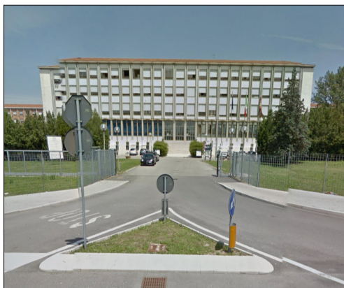
Cittadella Socio-Sanitaria ULSS 18 di Rovigo - via Tre Martiri n. 89

Dall'autostrada A13 : uscita Boara - Rovigo Nord, proseguendo in direzione di Rovigo, appena superato il ponte sull'Adige, svoltare a sinistra per la tangenziale Est e dopo 1Km alla rotatoria svoltare di nuovo a sinistra percorrendo il Viale Tre Martiri in direzione di Adria